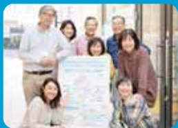
事務所ボランティア